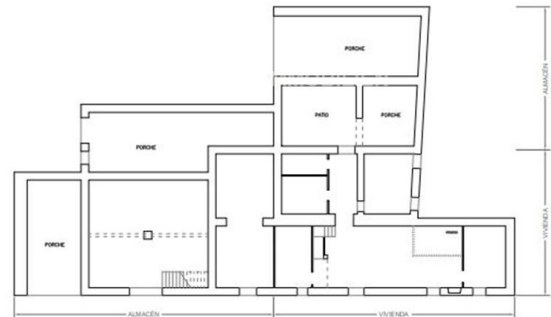
Pl. 000 S.P. CONSTR. VIVIENDA 151,24 m 2 S.P. CONSTR. ALMACÉN 142 m 2 S.P. CONSTR. PARRUC 238,12 m 2